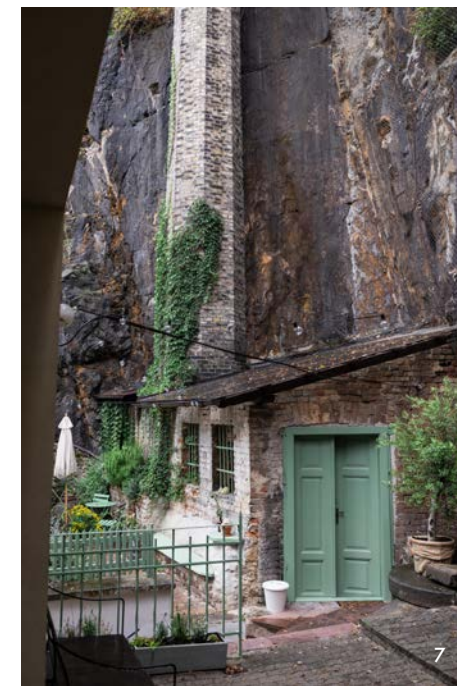
5. Kontrast nabílených cihel s nepravidelnou strukturou, pravidelného obložení v elegantní šedé barvě a proužkovaného čalounění dodává kavárně rozměr útulnosti. 6. Ve společnosti exotických pokojových květin působí vykutaná skála jako děčínská variace na zimní skleník. 7. I během babího léta nabídne zahrádku i posezení v pískovcové skále romantická zákoutí.