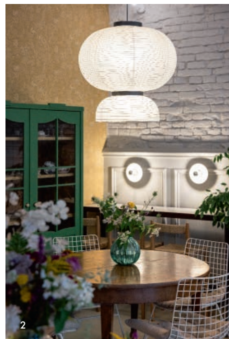
1. Honza a Radka Masojídkovi na zahrádce kavárny Kytky pod komínem. 2. a 4. Hlavní kavárna v přízemí, ke které v budoucnosti přibude i trojice apartmánů. 3. U posezení v pískovcové skále se bude přes zimu topit v kamnech stejně jako v hlavní kavárně. Právě tady sídlila před sto lety pekárna Rudolf Winter.